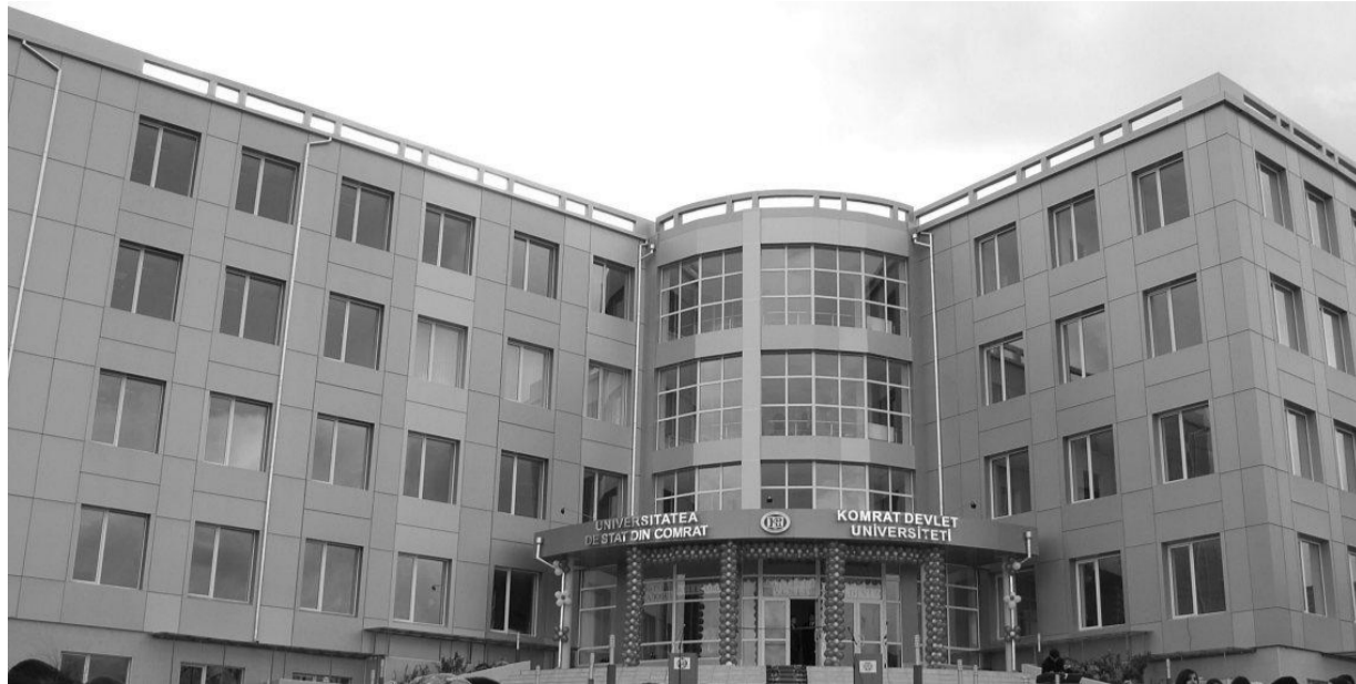
ском учебном заведении.

К созданному усилиями всего населения автономии Гагаузскому Национальному университету, ныне более известному под названием Комратский Государственный университет, в Гагаузии отношение особое. Это не просто учебное заведение – это неотъемлемая часть автономности гагаузов и это первый победный шаг на этом пути. Вспомним, что государственное признание университета, финансировавшегося поначалу исключительно на пожертвования граждан и организаций региона, состоялось раньше, чем признание гагаузской автономии. Но оно, это признание, было предвестником последующего признания всех чаяний гагаузского народа. И создания АТО Гагауз Ери.