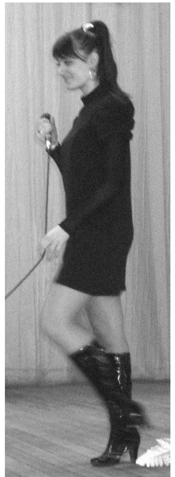
Уважаемые предприниматели Гагаузии!

Главное управление экономического развития, торговли, сферы услуг и внешнеэкономических связей Гагаузии доводит до вашего сведения, что в соответствии с Государственной Программой поддержки малых и средних предприятий на 2009-2011 годы, утвержденной Постановлением Правительства РМ № 123 от 10.02.2009 г. На МВЦ «Молдэкспо» под патронажем Правительства Республики Молдова, с 26 по 29 мая 2010 года пройдет X Форум малых и средних предприятий, в рамках которого состоятся следующие мероприятия: