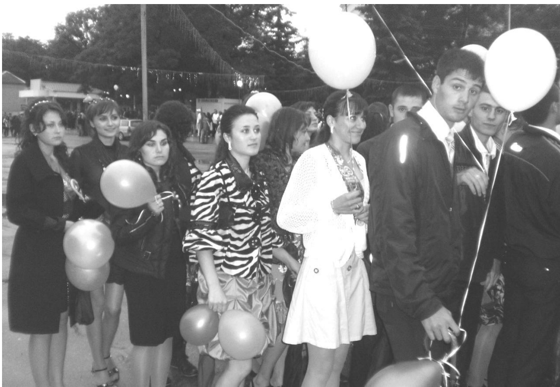
Конкурс! Конкурс! Конкурс! – «Я - очевидец»