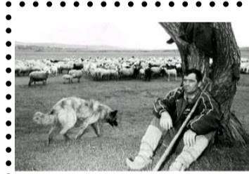
Гагаузия - твоими глазами

-Что лучше, Фанта или пиво? -Конечно пиво, попробуй за вечер выпить пять литров Фанты!